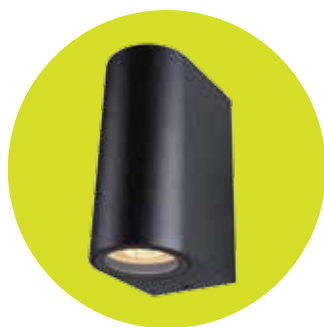
FL-LED WallBeam-Box BARREL-UD005 UP/DOWN Black