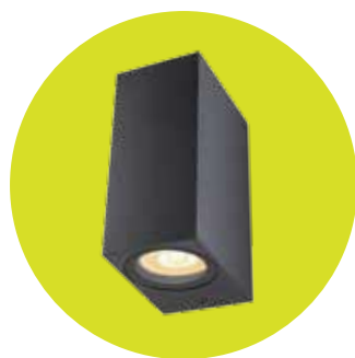
FL-LED WallBeam-Box CUBE-UD004 UP/DOWN Black