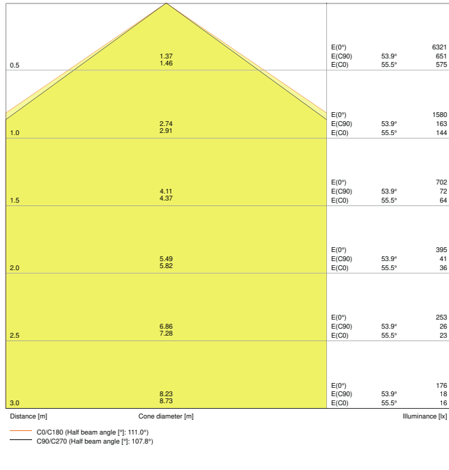
LDC typ cone